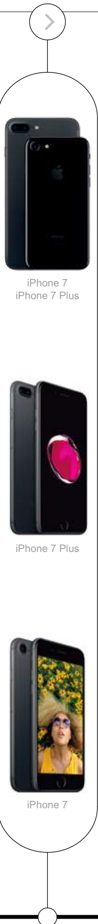
iPhone 7 iPhone 7 Plus