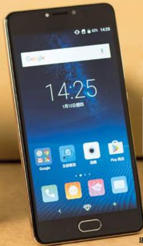
機側按鍵上鑲嵌了14顆SWAROVSKI人工寶石，充滿貴氣。

拍攝功能方面，SUGAR Y7 MAX具備自動美顏功能和防手震功能，搭配1,300萬後置鏡頭，以及智能偵測微笑拍攝功能，只要在光線充足的環境下，單手持機距離40cm即可偵測微笑自動倒數拍攝，方便直接，相信非常適合喜愛拍照的女性用家。