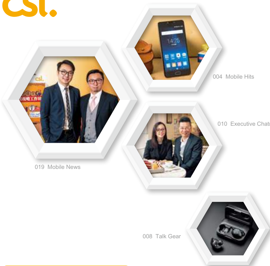
019 Mobile News