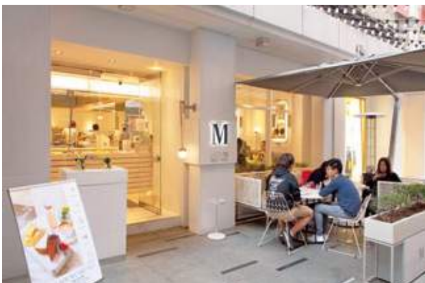
Lady M 銅鑼灣旗艦店位於 Fashion Walk，設有室內和露天座位，開揚寬敞，感受都市中的閒靜別有一份味道。

■ 這次我品嚐到你們各式各樣的精緻蛋糕和特色輕食，清新口味實在令我印象深刻。希望你們日後會推出更多新美食，業務再創高峰，謝謝你。