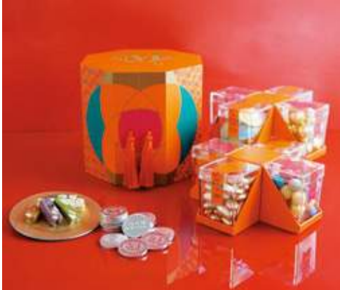
「1010 客」及 The Club 會員可換購 Lady M「如意糖果全盒」。