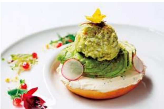
「Lady M 銅鑼灣旗艦店特設推介輕食菜式「紐約特色牛油果烘麵包」，也是他們在蛋糕以外的新嘗試。