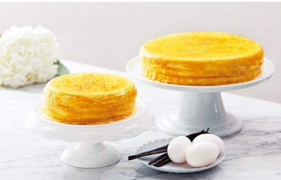
Lady M 蛋糕款式多多，每一款都別具特色，清新口味總令人心動一吃再吃。

T 因為香港氣候潮濕，會影響蛋糕製作。原味的「千層蛋糕」(Mille Crêpes) 始終是不少人的最愛。